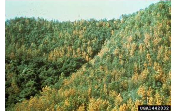
Numru ta' siġar milquta mill-marda tal- Pine Wilt

L-origini ta' dan in-nematode hija l-Amerika ta' Fuq, minn pajjiżi bħal Messiku, l-Istati Uniti u l-Kanada. Hija wkoll magħrufa bħala marda kiefra fil-foresti tal-Ġappun min fejn infirex għal ġewwa ċ-Ċina, l-Korea u t-Taiwan. Fl-1999 il- Pine Wood Nematode instab fil-Portugal, u fl-2008 gie rrapurtat fi Spanja.