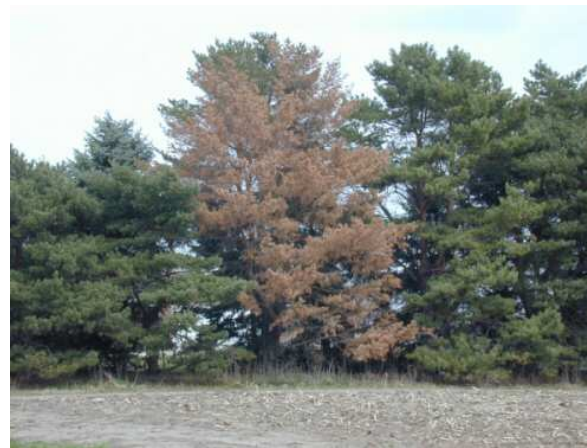
Siġra milquta mill-marda tal- Pine Wilt