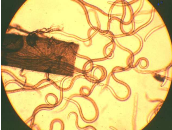
Nematodi taħt il-mikroskopju

Il- Pine Wood Nematode , magħruf bl-isem xjentifiku ta' Bursaphelenchus xylophilus , huwa l-kawża tal- Pine Wilt Disease . Dan in-nematode huwa organizzmu mikroskopiku li jagħmel ħsara lil dawn is-siġar.