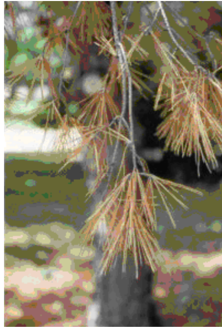
Sfurija u tbiel fil-weraq

L-ewwel sintomi li jkunu evidenti jinkludu sfurija u jitbielu l-weraq, li eventwalment twassal għall-mewt tas-siġra. It-tbiel jista' l-ewwel jidher fuq fergħa waħda biss iżda aktar tard tista' tiġi affetwata s-siġra kollha.