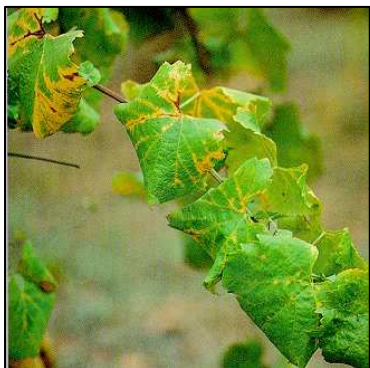
Sintomi tal-Flavescence Dorée fuq dielja

L-isem ta' din il-marda ġej mis-sintomi li jidhru fuq il-weraq. Fuq dwieli ta' għeneb abjad, eżempju Chardonnay , il-werqa tieħu kulur isfar dehbi li jleqq filwaqt li f'dawk ta' varjetà sewda, eżempju Merlot , il-weraq jieħu kulur ħamrani skur u l-vini homor jispikkaw. Is-sintomi jistgħu jkunu fuq il-werqa kollha jew inkella fuq xi parti tagħha. Il-werqa tinħass eħxen, il-bordura tinbaram 'l isfel u tieħu forma triangolari. Barra minn hekk il-werqa tinħass tqarmeċ meta titgħaffeg, bħall-werqa niexfa u b'kulur ileqq.