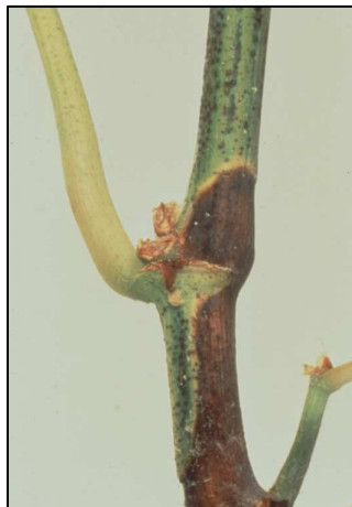
Sintomi fuq iz-zokk

Fuq iz-zokk, wieħed jista' jinnota dwawar u tikek skuri. Dawn it-tikek għandhom lewn iswed u dehra żejtija. Is-sintomu l-aktar gravi jidher fl-għenqud ta' l-għeneb, li jidbiel sakemm jinxfew kollu jew parti minnu. Meta l-marda tkun fi stat avanzat, l-għenieqed kollha jinxfu.