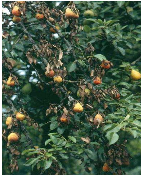
Sintomi tal-'Fire Blight', fuq siġra tal-langas

Fil-każ tat-Tuffieħ u l-Langas, is-sintomi tal-'Fire Blight', jaqdbu jitfaċċaw għall-ħabta tar-Rebbiega meta jerrġghu jibdew jōhorgu l-ward. Is-sintomi jibqgħu jōhorgu sal-ħarifa fejn imbagħad l-infezzjoni tieqaf u s-sintomi ma jibqgħux jōhorgu, izda l-mikrobu xorta jibqa fis-siġar. L-infezzjoni terġa' tohroġ mall-bidu tal-istaġun riproduttiv ta' wara.